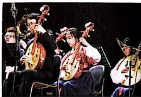
图 8-1-3 中国民乐演奏

节奏和节拍是音乐中相辅相成的两个部分。节奏的变幻无穷象征了音乐的自由不羁，但其实音乐又被约束在节拍中，看似矛盾的二者却和谐地共存于音乐之中，这正是音乐的奇妙魅力所在。节奏、节拍是音乐中极其重要的音乐要素，它们与音高共同构筑了音乐的旋律主体，相辅相成，共同支撑起音乐的律动。