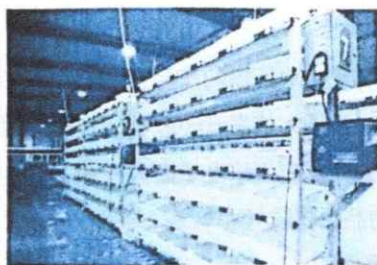
图5-1 电子标签拣选货架

语音拣选，是指仓库工作人员根据语音指导操作，同时通过语音传达他们的反馈。他们的双手可以自由操作，拣选订单。语音拣选既提高了订单拣选的质量，也提高了速度。语音拣选如图5-2所示。